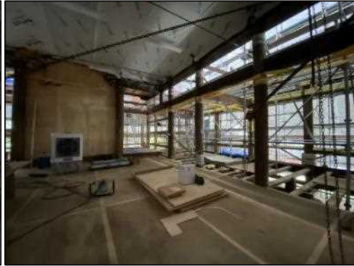
【施工中（令和4年2月）写真】