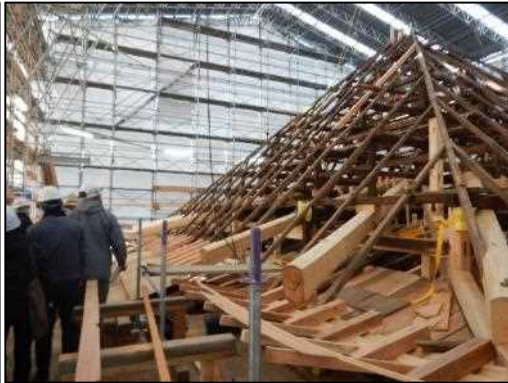
【施工中（令和4年6月）写真】