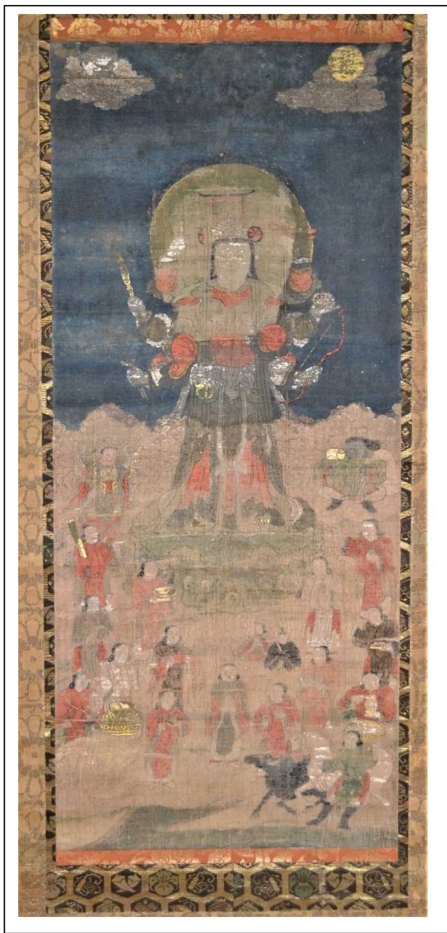
妙傳寺所藏「弁財天十五童子像」