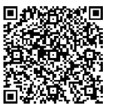
あゆコロちゃん と学ぶ！消火器