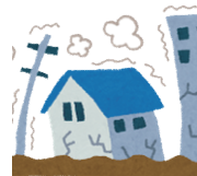
地震時の通電火災を防ぎましょう

また、通電火災を防ぐため、避難するときはブレーカーを落とし、再通電時は電気機器類に破損がないこと、近くに燃えやすいものがないことを確認しましょう。