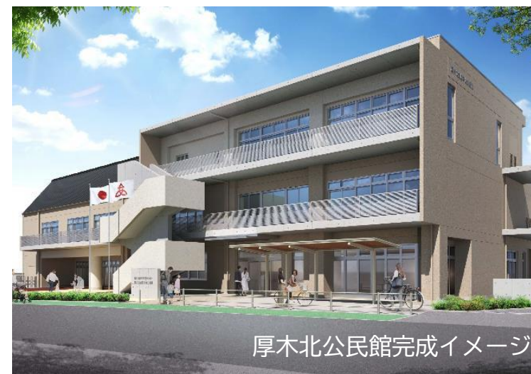
厚木北公民館完成イメージ