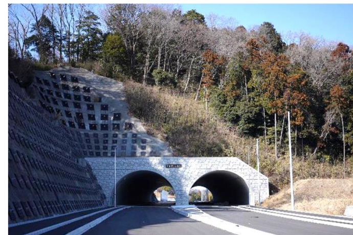
整備が進む厚木環状3号線（上下とも）