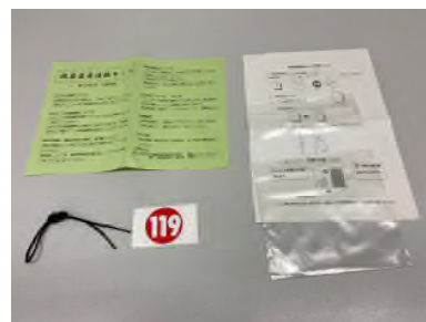
救急医療情報セット

緊急時に、一人暮らしの高齢者や在宅の障害者などが、救急車を要請した際に、救急隊員がセットに保管された医療情報を活用することにより、迅速かつ適切な救急活動に役立てることができます。