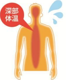
深部体温上昇 脱水 (高体温)