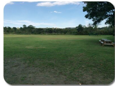
5 上三田青少年広場