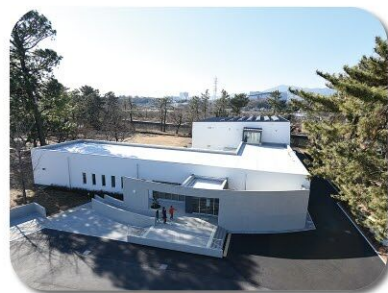
6 あつぎ郷土博物館