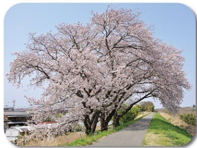
2 鮎津橋上流の風景