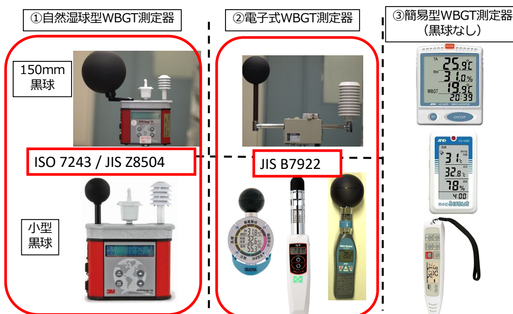
図2. 様々な市販 WBGT 測定器とその分類

黒球を持たない簡易型の測定器であるが、WBGT 値を表示するものも存在する。WBGT の算出に必要な黒球を有さないことから、日射のある環境(屋外等)での使用には適さない(齊藤と澤田, 2015)。