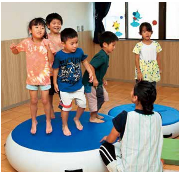
エアマットを使い全身運動を楽しむ幼稚園児