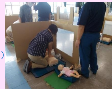
救急救命講習の様子

提供会員が支援を開始する前に受講しなければならない大切な講習です。子どもの救急救命講座(救急救命講習Ⅲ)は、平成29年4月より提供会員には必須となりました。未受講や受講証の有効期限が切れている提供会員の方、次年度以降の講習会や消防署での講習会を受講しましょう。