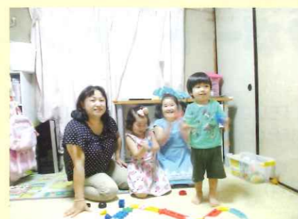
タウンニュース掲載写真