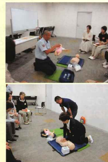
「救急救命」講習の様子

幼保無償化に伴い、援助活動報告書の書式を変更し、記入例を作成しました。なお、詳細につきましては、事務局までお問い合わせください。