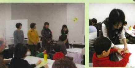
丁寧に指導いただいた講師の方々