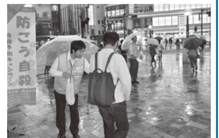
チラシなどを手渡し予防を呼び掛け

平成19年の自殺者数は、人口10万人当たり22.3件。年により増減はあるものの、セーフコミュニティ認証取得後の平成24年には18.2件となり、減少につながっています。