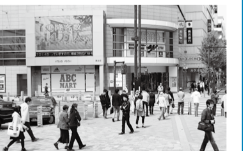
本厚木駅の1日の乗降客数は約14万人

映像広告のほか、写真を利用した静止画広告などもあります。お気軽にお問い合わせください。