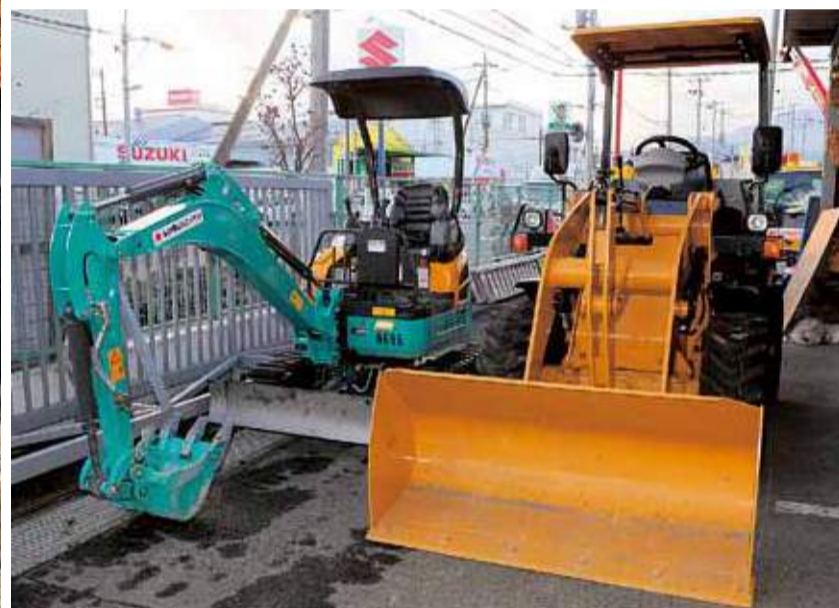
既存の重機よりも小さなホイールローダー（右）と油圧ショベル（左）を道路補修事務所に配備（冬期のためのリース契約）