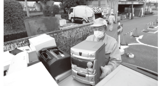
ボックスに入らない小型家電は環境センターへ(50センチを超える場合は、粗大ごみとして有料で引き取り)