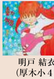
明戸 結衣子(厚木小4年) 固生活環境課 ☎225-2750