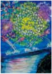
竹花 由乃 (戸田小6年)