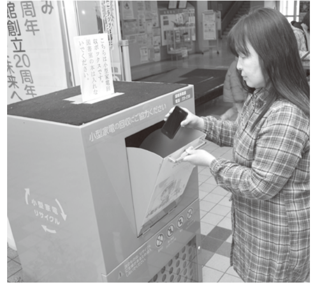
入力されている個人情報(個人情報は消去してからボックスへ)