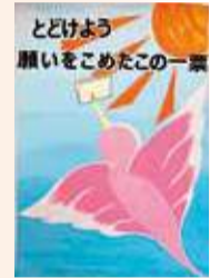
渋谷 祐香梨(上荻野小5年) 大塚 敬斗(藤塚中3年)