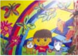
佐々木 大輔(飯山小2年) 固環境事業課 ☎225-2793