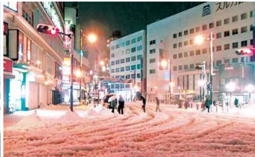
昨年2月15日の積雪では、停電や交通の乱れなどが生じた