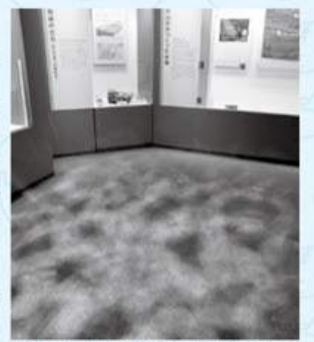
床面に投影された水の揺らぎは、海の中を再現

その他にも厚木の歴史や自然を楽しみながら学べる展示がたくさん。厚木の新名所、あつぎ郷土博物館。ぜひ足を運んでみてー。