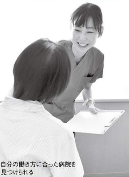
自分の働き方に合った病院を見つけられる