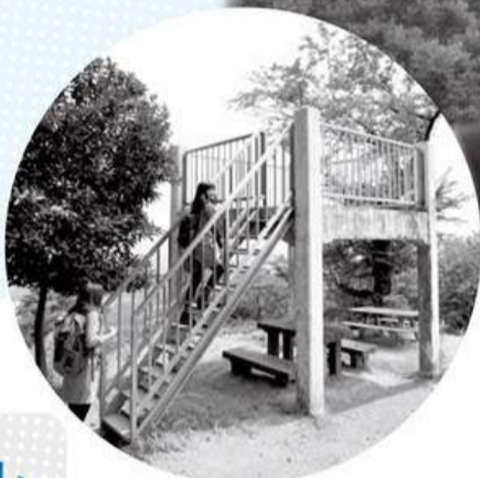
白山山頂の展望台