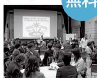
各地域の事例を交えて意見交換

地域で子どもを育てる「地域ぐるみ家庭教育支援」の活動発表や講演、情報交換会を開催します。テーマは「公民館と地域との協働」です。