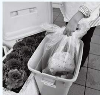
各家庭で用意したポリごみ箱などにごみ出しをすると、収集作業員が戸別に回収