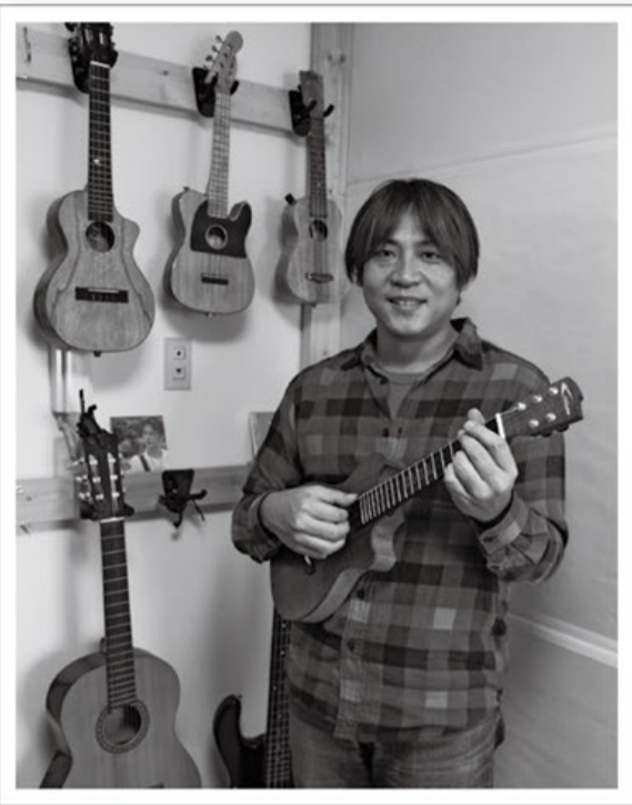
中学から始めたギターやバンド活動で培ったテクニックを駆使した躍動感あふれる演奏スタイルが特長