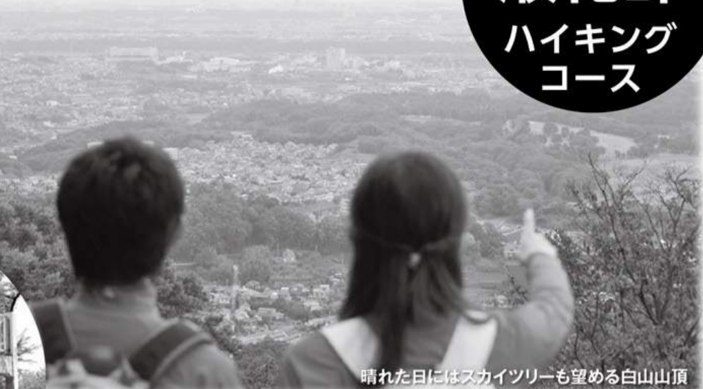
晴れた日にはスカイツリーも望める白山山頂