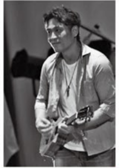
2月24日にレンブラントホテル厚木で行われる無料のハワイアンイベント「ALOHA TIME」で演奏する。

ウクレレは小さく軽いため、子どもから高齢者まで楽しめる楽器です。今後も多くの人に身近に親しんでもらえるよう、活動を続けていきたいです。