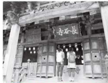
縁結びで人気の飯山観音長谷寺