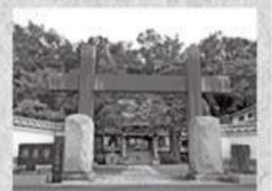
天井に句が描かれた「格天井」がある源養寺