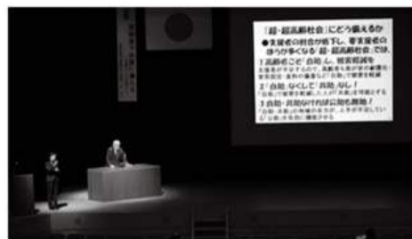
1月の市民防災研修会では防災の専門家が自助の大切さを講演

災害時に大切な命を守るためには日頃からの「自助」の心構えが必要です。いざという時に互いに助け合う「共助」を実現するには、まず自分の身を守ることが不可欠です。一人一人の自助力を高めて、災害に強いまちをつくりましょう。