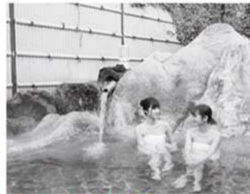
下山後は、温泉を満喫