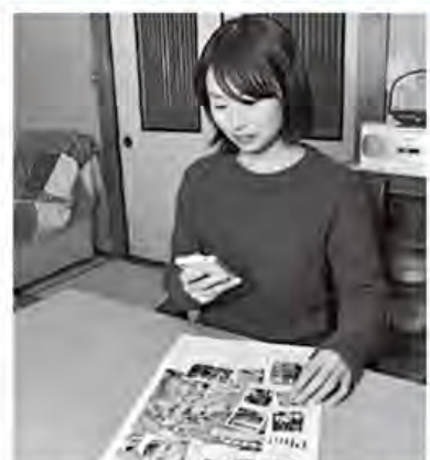
パソコンやスマホから回答できる

「広報あつぎ」や市広報番組「あつぎ元気Wave」で紹介する市の施策やサービスなどについて、毎月1回のアンケートに、意見を寄せていただくモニターを募集します。