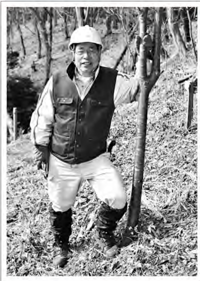
ようやくここまで成長した桜に思いひとしお