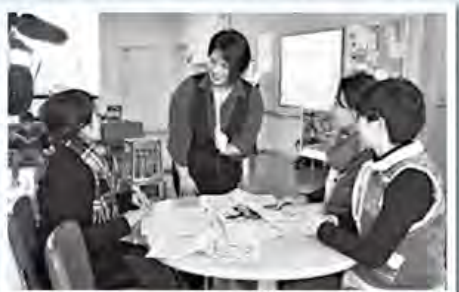
おかん時間発行の経緯などをレポート

現在市には、紙おむつの支給や子育て支援センターなど、充実した環境が整っているので心強いですね。こうしたサービスを有効に活用しながら、皆さんが子育てを楽しめることを心から願っています。