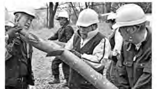
伐採など大掛かりな作業は皆で協力

私たちの活動が本当に実を結ぶのは孫が大きくなったころ。後世の人たちに桜といえば鳶尾と呼ばれるようこれからも桜を植え続けていきます。