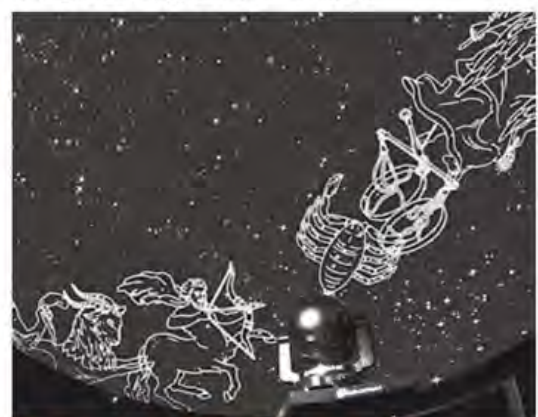
《「催し」は2面に続きます》

■ 科学工作教室「飛ばして遊ぼう」 4月28日、13時15分～15時45分。身の回りのもので、飛ぶおもちゃを作る。小学生以上30人(付き添いの方も要予約)。無料。4月7日(市外の方は8日)9時から受け付け。先着順。☎172829 いずれも会場、問い合わせは子ども科学館 ☎221-4152。