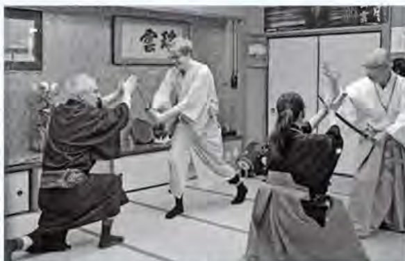
平成28年度に実施したモニターツアーでは、伝統舞踊や郷土料理を体験してもらい、観光資源の発掘につなげた

おもてなしの在り方を学ぶ研修を開催。事業者の他、ボランティアガイドや地域住民などと一緒に、外国人にも居心地の良いまちづくりを目指す。