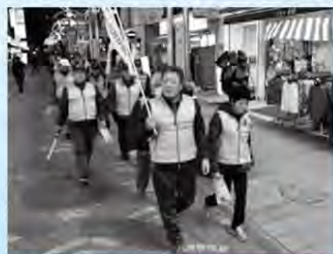
多くの地域住民が自主的に参加

10年以上前のこと、「本厚木駅の周辺は怖い」という声が多くありました。違法な客引きなどの迷惑行為や犯罪行為が、まち全体のイメージを悪化させていました。こうした印象を改善するために、地域住民と厚木警察署、市が協力して駅周辺の定期パトロールを実施し、「見せる警戒」につなげています。