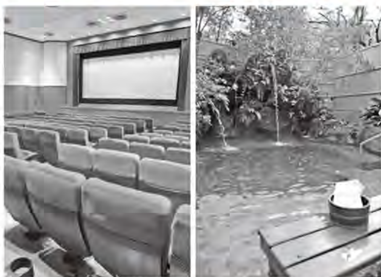
市内で映画や温泉などがお得に楽しめる

【対象】市内在住の65歳以上 【交付期間】3月30日～平成31年3月29日 【助成額】入浴施設(1回500円)や宿泊施設(1回1500円)など。 ☎直接、介護福祉課、公民館または文化会館(休館日を除く平日9時～17時)へ。