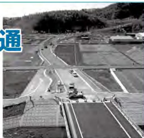
玉川には「赤坂橋」が架かり、NTC入口まで道につながる