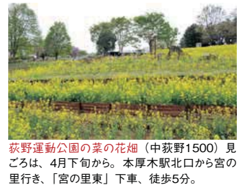
萩野運動公園の菜の花畑(中萩野1500)見ごろは、4月下旬から。本厚木駅北口から宮の里行き、「宮の里東」下車、徒歩5分。