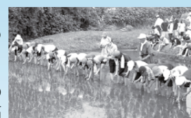
国際理解週間での田植えの様子

農園では、七沢しあわせクラブやJAあつぎ玉川支所の皆さんの指導の下、低学年は小麦、中学年は野菜、高学年は米などを中心に栽培。種(苗)植えから収穫まで年間の活動を通して、栽培することの難しさや収穫の喜びを体験することで、豊かな心が育てられています。