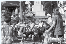
健やかな成長を育む子ども会活動

地域の子どもと保護者たちの交流の場である子ども会の活動に参加してみませんか。子ども会は、地域の絆に支えられ、さまざまな活動を通じて子どもの豊かな成長を育てています。