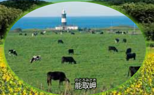
のどろみさき 能取岬

厚木市は網走市のほか、横手市、揚州市(中国)、軍浦市(韓国)、ニューブリテン市(米国)と友好都市を締結しています。