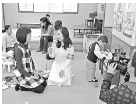
児童館で活動する子育てコンシェルジュにインタビュー

「あつぎびより」では、市広報番組などで活躍する市民リポーターが、厚木の魅力などをお伝えしていきます。