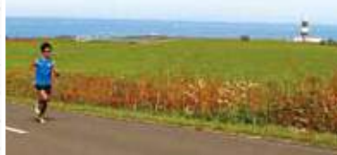
オホーツク海沿岸を走るコース