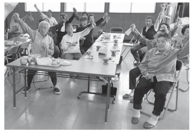
地域で実施される介護予防の健康体操

☎介護保険課 ☎225-2240 (介護保険の給付など) ☎225-2391 (介護認定など) ☎225-2393 (介護保険料など)