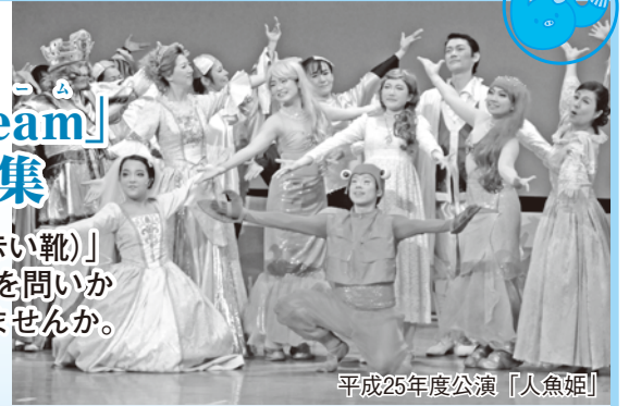
平成25年度公演「人魚姫」

《内容》練習や公演の運営手伝い（受け付けなど）。☎7月31日までに文化生涯学習課へ。