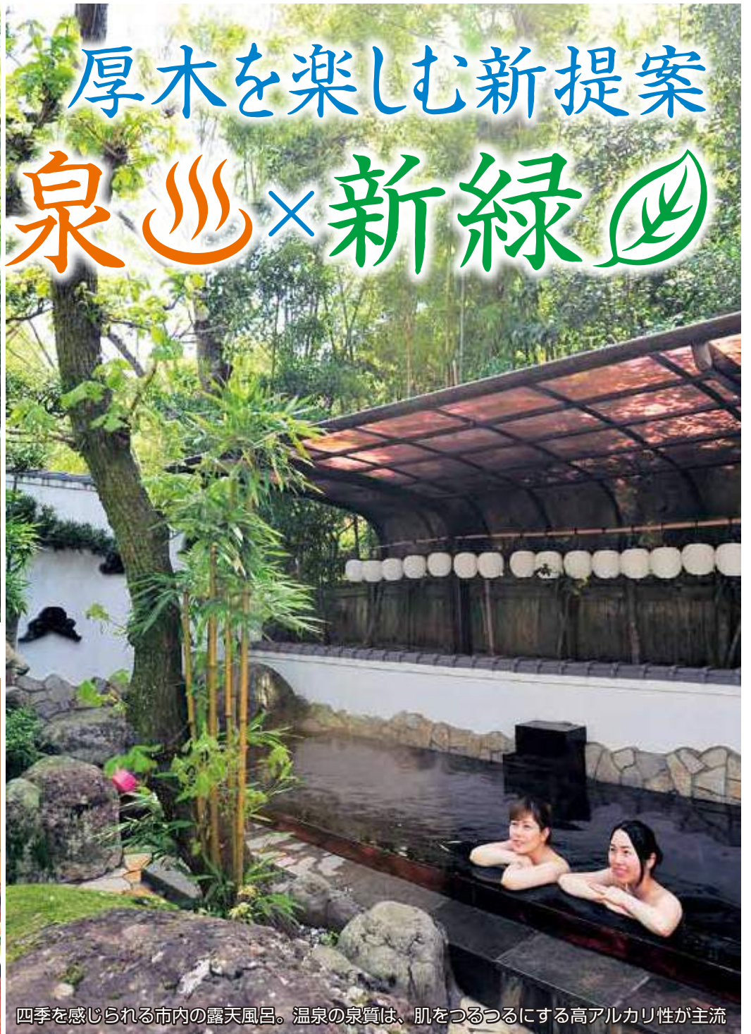
四季を感じられる市内の露天風呂。温泉の泉質は、肌をつるつるにする高アルカリ性が主流