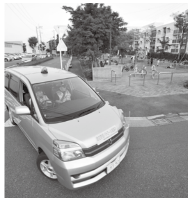
地域を巡回する青パト

皆さんは青いランプを付けた防犯パトロール車、通称「青パト」を知っていますか。現在、102台の青パトが市内を巡回し、地域の安全を見守っています。