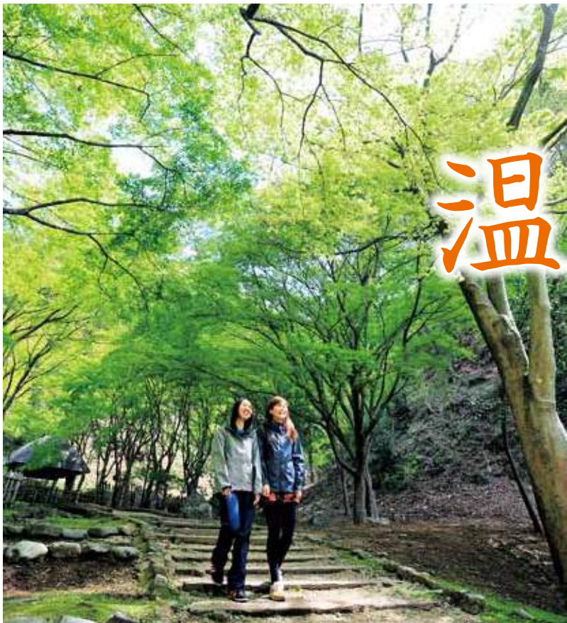
①鮮やかな新緑に包まれた七沢森林公園のハイキングコース ②温泉宿の料理の一例。地元で採れた新鮮な山菜や川魚などを提供