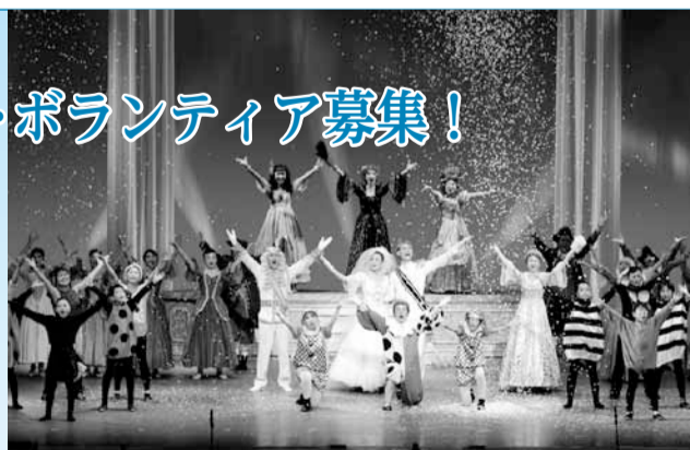
－昨年の市民参加ミュージカル「シンデレラ」の様子