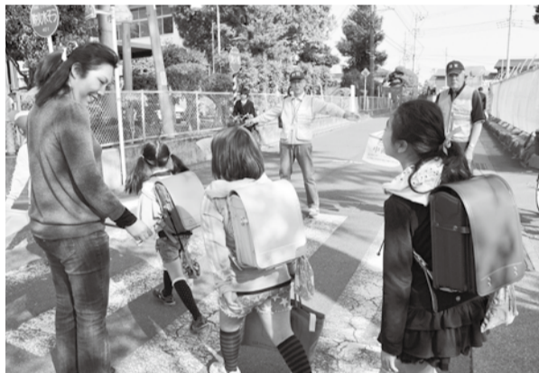
地域住民による通学児童の見守り活動も広がっている

動を支援していかなければなりません。そして市民の皆さんは、まず地域の実情をよく知ってほしいと思います。課題は地域によって異なるので、地域に合った取り組みが必要です。自分たちの地域は、自分たちで守るという心掛けが大切です。