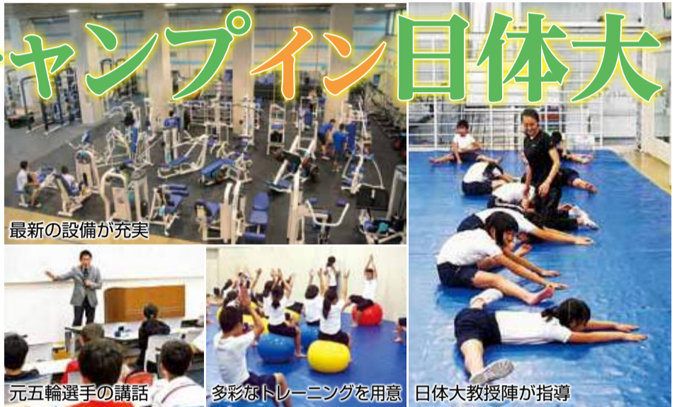
最新の設備が充実