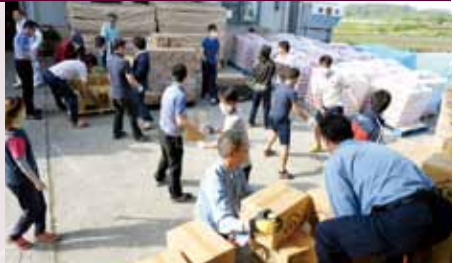
支援物資を現地で荷降ろし

さらに、4月25日から4日間、応急危険度判定士の資格を持つ職員2人を派遣。大地震で被災した建物を調査し、余震などによる倒壊や外壁・窓ガラスの落下の危険性の判定に当たりました。今回の地震は、古い建物の倒壊による死者が多いことが特徴です。市では無料で木造住宅の耐震診断を実施していますので、ぜひご利用ください（詳細は6面）。