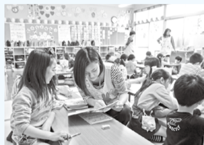
指導員がいるので安心

昼間家庭に保護者がいない児童の遊びと生活の場として、夏休み 期間の放課後児童クラブの受け入れを始めます。