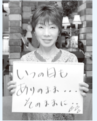
3人へのメッセージを手に

学校で働いていると、毎年300人近い生徒さんとの別れがあります。とても寂しかったのですが、「YELL」の歌詞に励まされ、将来を応援する気持ちで見送ってきました。3人にはこれからも変わらず自分たちらしく、すてきな曲をたくさんの人に届けてもらいたいと願います。