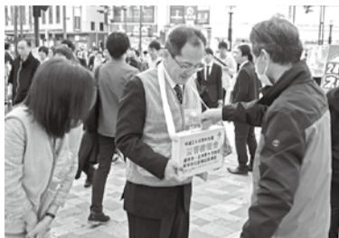
街頭募金活動も実施

肥後銀行三郎支店、ゆうちょ銀行、三井住 友銀行すずらん支店、三菱東京UFJ銀 行やまびこ支店、みずほ銀行クヌギ支店、 熊本銀行日赤通支店、大分銀行ソーリン 支店、大分県信用組合本店営業部 ※口座番号と名義は市ホームページでご 確認ください。