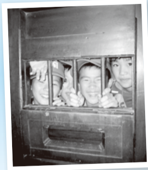
博物館「網走監獄」を見学

市の友好都市・北海道網走市で、農作業やマスの解剖、文化施設の見学などを体験します。大自然の中で自然の厳しさや大切さを学び、仲間たちとの友情の輪を広げましょう。