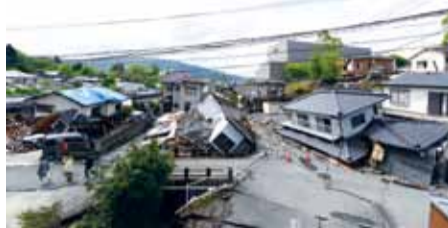
地震で多数の家屋が倒壊

4月14日に発生した熊本地震は、最大震度7を観測した激しい揺れや相次ぐ余震を引き起こし、大きな被害をもたらしました。市では、全国朝市サミット協議会の縁から、熊本県益城町に飲料水や毛布などの支援物資を即座に搬送。被災状況と支援内容を把握するため、職員3人を派遣しました。また、6月30日まで市内29の公共施設に災害義援金の募金箱を設置するなど、募金活動を展開しています（詳細は7面）。