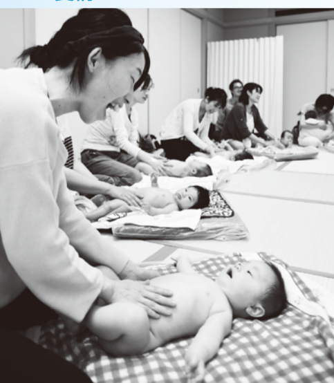
血行促進によるリラックス効果も大きい