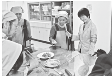
厚味会のメンバーにインタビュー

皆さんに共通しているのは、地域への愛情と活動への熱意、チームワークの良さ、そして明るい笑顔でした。活動の中心は私と同年代のリタイア世代です。生き生きと活躍している皆さんと接して「もう年なんだから」と言い訳している自分を反省しました。「病は気から」ならぬ「老いは気から」と自分に言い聞かせ、元気に過ごしていこうと思います。