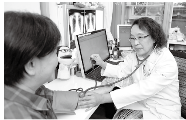
特定健診をきっかけに、規則正しい生活習慣を