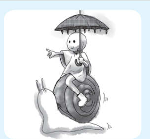
「マイマイ・ペース」