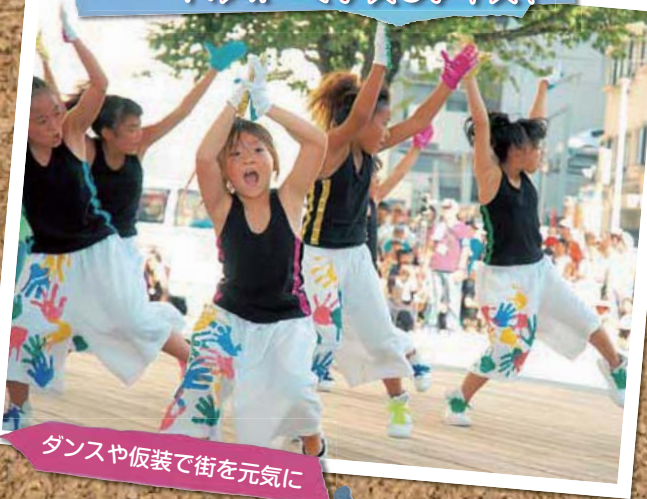
ダンスや仮装で街を元気に

《日時》8月4日、14時～17時 ※7月9日事前説明会 《会場》厚木公園ほか 《内容》仮装やフリーパフォーマンスなど。1団体につき演技時間4分以内 《出場条件》①10人～50人程度の団体②会場放送設備は主催者のものを使用③エンジン付き車両の持ち込みは禁止など。抽選 《参加費》1団体3,000円