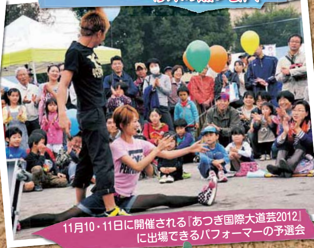
11月10・11日に開催される「あつぎ国際大道芸2012」に出場できるパフォーマーの予選会

《日時》8月5日、13時～《会場》厚木公園(予定)《内容》大道芸の披露(15分～25分を予定)《出場条件》18歳以上(性別・国籍不問)。書類審査あり(事前に大道芸の映像を記録したCD、DVD、VHSなどを商業にぎわい課に送付またはお持ちください)《参加費》無料