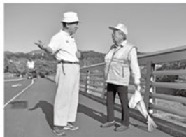
地域の方との会話も大切な時間

森の里は温かい地域ですね。ボランティアで得た縁を大切に、自分の足で歩ける限り続けていきたいと思っています。