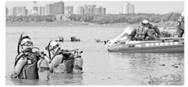
事故を想定し、市では潜水訓練を実施

市内の河川では毎年、6月から8月にかけて水の水難事故が増加しています。流れが速い所や深みのある場所は、非常に危険です。川でのレジャーには十分注意しましょう。