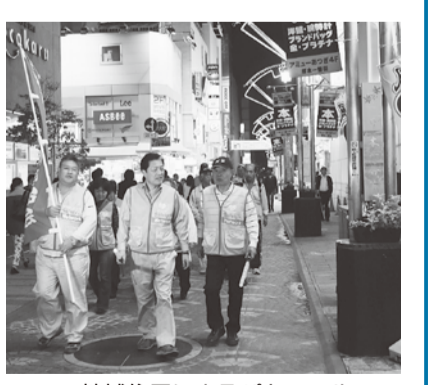
地域住民によるパトロール

市では平成18年から、市民の皆さんや警察署などと連携し、定期的に本厚木駅周辺の夜間パトロールを実施しています。さらに、26年4月に客引き行為等防止条例を施行してから、指導員によるパトロールをほぼ毎日実施しています。こうしたパトロール活動は、本厚木駅周辺の犯罪防止や、体感治安（数値上のものではなく、人々の感覚的な治安）の向上につながっています。