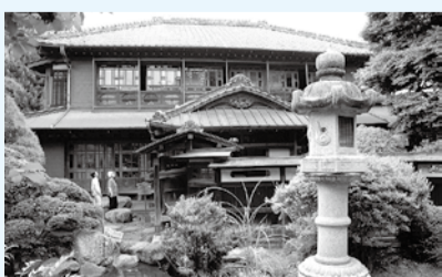
趣きある古民家岸邸