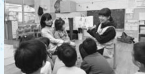
保育所で楽しく遊ぶ子どもたち