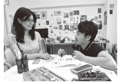
事務所でデザイン作りに打ち込む二人

上げました。市内の個性なお店やグルメをはじめ、街で見掛けた猫や自作のキャラクターなど、目立たないけれど誰かの心に訴えかけるような街の魅力を紹介しています。世代を問わず、目にした方に「日曜の朝のコーヒー」のような心地よさを感じていただけるように、仕事でも日常でも、自分たちが感じる厚木の楽しさをこれからもささやいていきたいです。