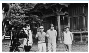
七澤神社本殿の境内でレポート