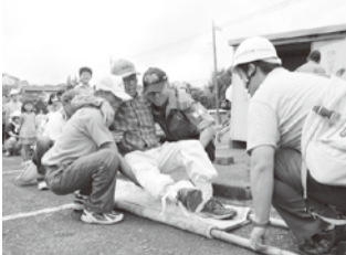
訓練の参加も意識向上の一助に

このコーナーでは、市が取り組んできた災害対策などを紹介しました。これからも市民の皆さんと力を合わせ、災害に強いまちづくりを進めていきます。