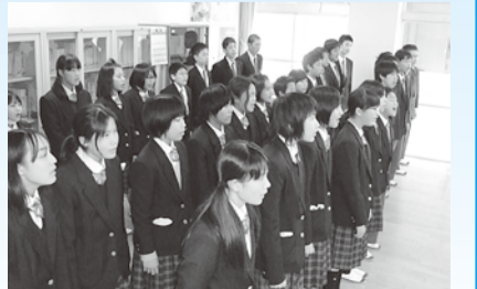
歌を通じて活動を広めるエコソングPR

生徒たちは、身の回りの環境を見直し課題を解決しようと活動しています。一人一人が楽しいと思えるような取り組みを考え実践することで、活動の輪を全校・地域に広がっています。