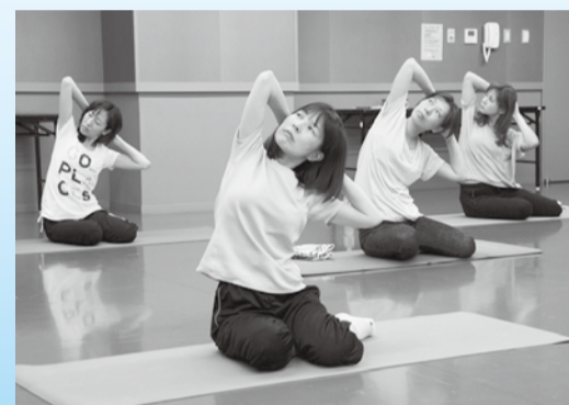
健康的なフィットネスを一緒に始めませんか

㊦8月12日までに健康づくり課☎225-2201へ。抽選。※A～Cのいずれか1コースのみ。AとC（午前コース）は託児あり。