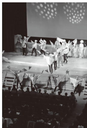
文化会館のステージで披露