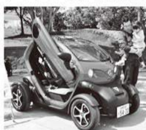
テントウムシのような色が特徴

日産自動車から借り受けた超小型電気自動車「ニューモビリティコンセプト」の愛称を募集します。車はぼうさいの丘公園の新たなシンボルとして園内のパトロールなどで活躍します。