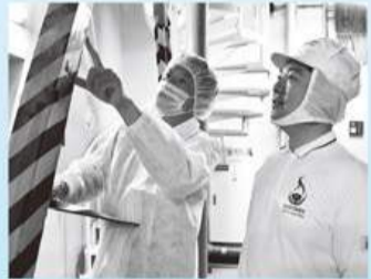
市内の隅々まで丁寧に点検