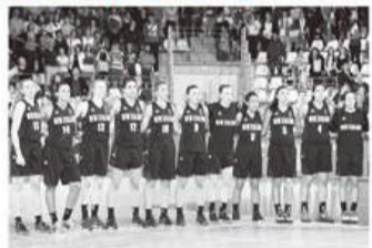
五輪で8位入賞も果たすTall Ferns

先着1000人に厚木市とTall FernsのオリジナルグッズをプレゼントするBoo～!!!