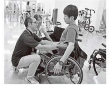
患者さんに合った乗り心地を提案

リハビリに訪れる皆さんの悩みや要望を一緒に解決し、喜び合う瞬間が、何よりのやりがいです。今後も皆さんの声に応えながら、誰もが使いやすい福祉用具の開発を実現していきたいと思ひます。