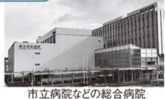
市立病院などの総合病院