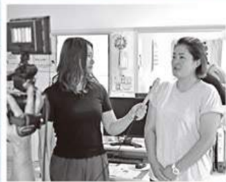
企業内保育に取り組む企業を取材

「限りある時間をどう使うかは、仕事に限らず子どもから高齢者まで全ての人に関わりがある。大切なのは、自分に合った時間配分を見つけること」。専門家の方が話してくれた言葉が胸に響きました。皆さんが教えてくれたように、私も自身の生活を定期的に見直し、さらに充実した生活や自分に合った働き方を見つけたいと思います。