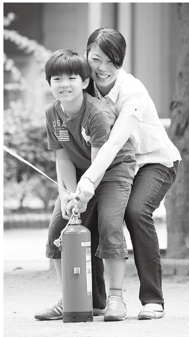
訓練に参加し、いざというときに備えましょう

9月1日の「防災の日」を中心に、市内各地で総合防災訓練が実施されます(左下参照)。防災訓練をはじめとする地域の行事に進んで参加し、日ごろから地域の皆さんと顔見知りになっておくことは、災害時に大きな力になります。「自分たちのまちは自分たちで守る」という