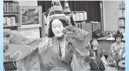
昨年100周年を迎えた相模里神楽

ター。親子で「ふれあい遊び」を楽しむ。市内在住の歩行可能な1歳児と保護者15組。無料。☎9月13日まで。ウェブ申☎①130340②130341