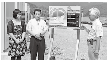
神奈川電力の方が詳しく解説

周囲の緑地には、沢山の桜の苗木が植えられていました。数年後、発電所と桜が厚木の名所になるのが今から楽しみです。