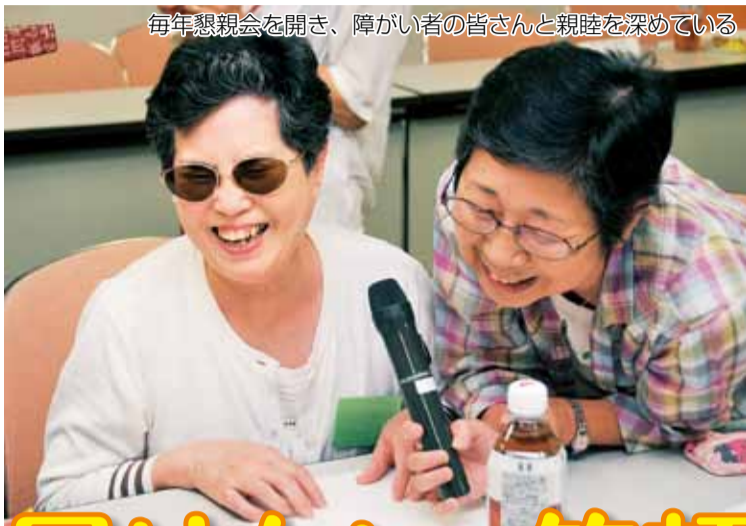
毎年懇親会を開き、障がい者の皆さんと親睦を深めている

編集・発行 / 厚木市政策部広報課 〒243-8511 神奈川県厚木市中町3-17-17 TEL.046-223-1511(代) FAX.046-223-9951