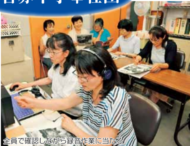
全員で確認しながら録音作業に当たる