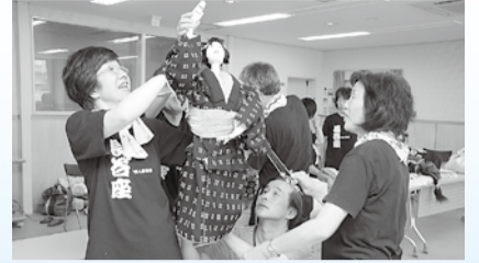
相模人形芝居「長谷座」の稽古の様子