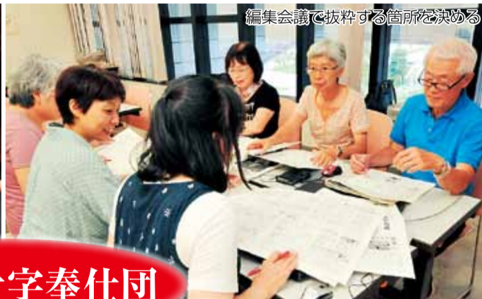
編集会議で抜粋する箇所を決める