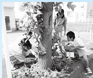
花を植える生徒たち

生徒たちは、地域の中の一員として、これからも地域に貢献できる活動に積極的に取り組んでいきます。