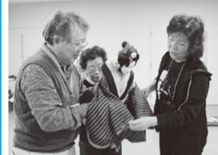
実際に人形を見て、操作を体験

《日時》11月3日、①10時～12時②14時～16時 《対象》各回定員20人 《費用》無料 ☎電話で10月22日までに文化生涯学習課 ☎225-2508へ。抽選。㊿1