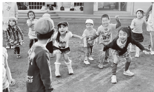
夕方幼稚園で伸び伸びと遊ぶ子どもたち