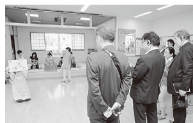
児童館で行われた現地審査

市がセーフコミュニティの認証を取得してから5年目となり、再認証審査の年を迎えました。ことし7月、WHO(世界保健機関)セーフコミュニティ協働センターから審査員が派遣され、現地審査を実施。実際に市内の活動状況を視察したほか、5年間の取り組みを写真やデータで確認しました。