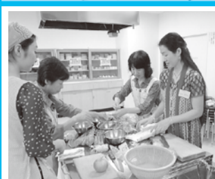
外国人の方と料理を作って交流