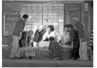
昨年は90分にわたる物語を披露

当日は、演者が気持ちよく演じ、来場者が心の底から楽しめるよう、音響担当として舞台をサポートします。劇を通じて、子どもたちに地域の伝統やつながりの大切さ、愛着などを感じてもらえたらうれしいです。