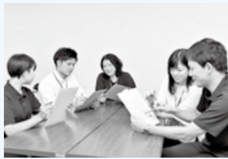
端末機の導入でペーパーレス会議が実現