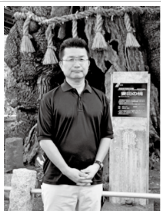
今年の芝居では、妻田薬師にまつわるさまざまな言い伝えを面白おかしく紹介