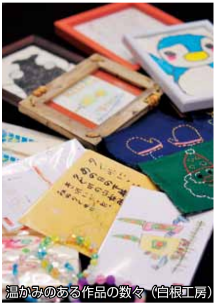
温かみのある作品の数々 (白根工房)

編集・発行 / 厚木市政策部広報課 〒243-8511 神奈川県厚木市中町3-17-17 TEL.046-223-1511(代) FAX.046-223-9951