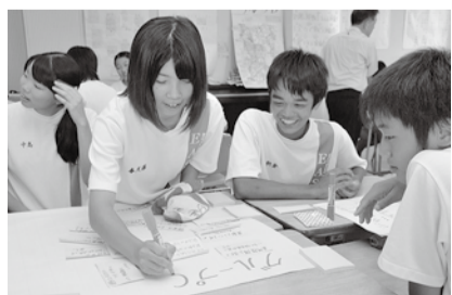
生徒全員で危険箇所を洗い出し

これまでにワークショップを4回開催。校内外のけがの発生状況、いじめ・暴力、交通事故など、さまざまな視点から意見を出し合い、学校の問題点や課題を抽出しています。学校と地域が一丸となった安全な教育環境づくりが、中学校にも広がっています。