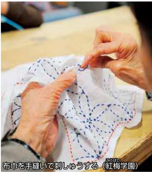
布巾を手縫いで刺しゅうする (紅梅学園)