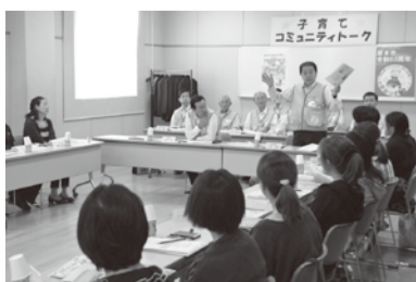
市の子育て支援を説明する小林市長

トークではこれまで、「子ども医療費助成」や「自転車ヘルメット購入費助成」の拡大、「教室への冷暖房設置」などを実現。今後も、現地対話による市民ニーズに即した市政を進めていきます。