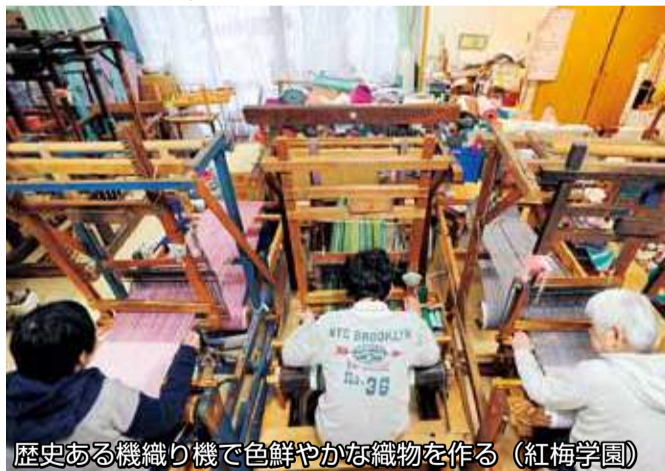
歴史ある機織り機で色鮮やかな織物を作る (紅梅学園)