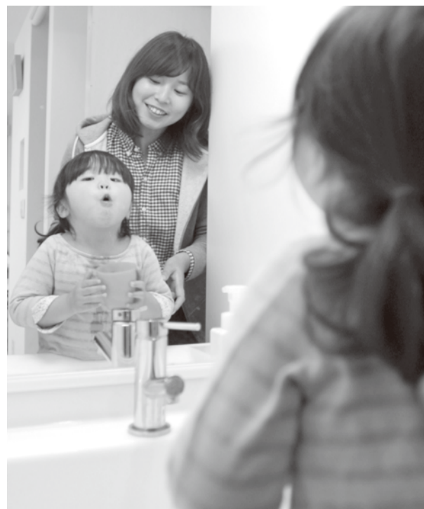
外から帰ったら必ずうがい