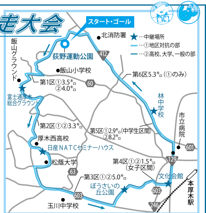
※当日は、交通規制にご協力ください。