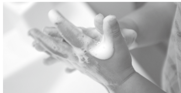
手洗いは15秒以上かけて手首までしっかりと洗う