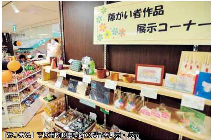
「あつまる」では市内19事業所の製品を展示・販売