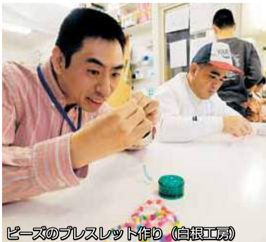
ビーズのプレスレット作り (白根工房)