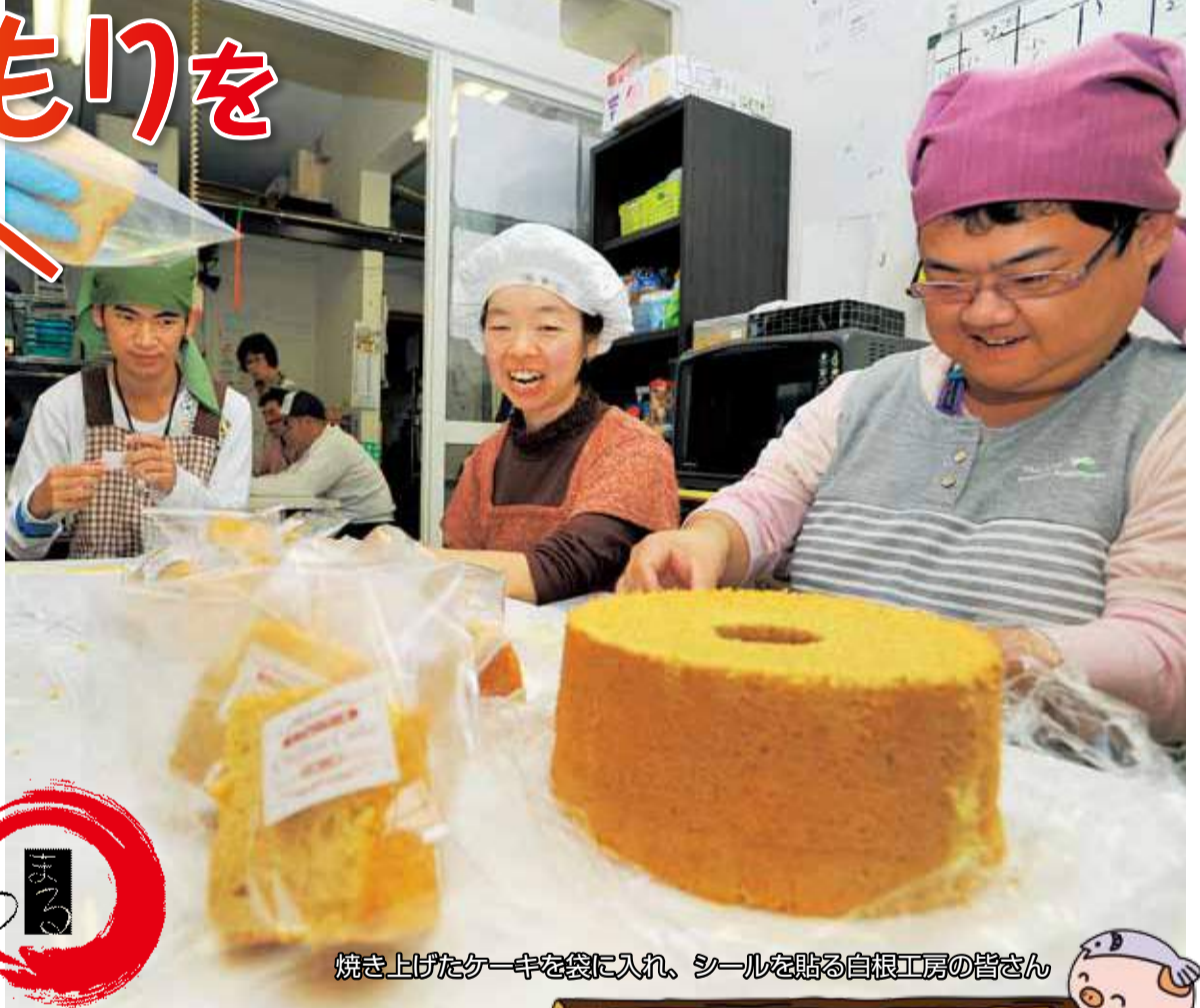
焼き上げたケーキを袋に入れ、シールを貼る白根工房の皆さん