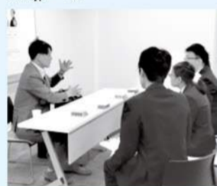
人事担当者との情報交換

☎電話またはEメールに氏名、電話番号を書き、11月22日までに（株）学情☎03-3545-7323・☎atsugi.support@gakujo.ne.jpへ。