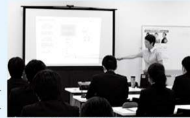
就職に必要な知識などを習得

市内企業への就職を支援する催しを開催します。気軽に参加してください。☎産業振興課☎225-1830