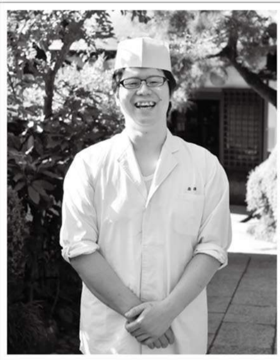
第38回日本料理全国大会の30歳以下の部で厚生労働大臣賞を受賞。地元のアユやイノシシ肉を使ったメニューで挑んだ