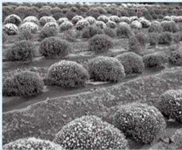
ザルギクは満開になるとざるを逆さにしたような丸い形になる

10月下旬、カメラを手に荻野運動公園や森の里若宮公園、飯山花の里を散歩してきました。黄葉する木々や彩りを添えるコスモスなどが美しく、秋も本番だと感じました。飯山花の里で撮影したザルギクは、11月が見頃。満開になった頃、もう一度行ってみたいと思います。