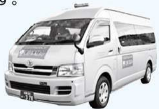
実際に市内を走る車