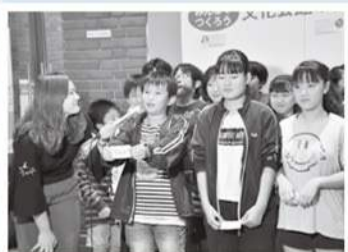
アカデミー生の文化会館への思いをレポート

開館40周年という節目を迎え、文化会館はこれからも私たちに感動や安らぎなど、さまざまなことを文化・芸術を通して与えてくれることだろうと改めて感じることができました。