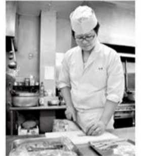
仕込みに力を注ぐ

今回、日本料理の全国大会で最高位に当たる賞に選ばれ、喜びと同時に身の引き締まる思いです。いつか地元で自分の店を開くという夢に向かって、これからも精進していきます。