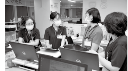
《「募集」は4面に続きます》

《試験日》2022年1月16日《対象》1992年4月2日以降生まれで①助産師または看護師免許を持つ②22年の国家試験で取得見込み一のいずれかに該当する方若干名。☎市立病院や市役所本庁舎、本厚木・愛甲石田駅連絡所、市立病院HPにある申込書を、直接または郵送で22年1月5日(消印有効)までに〒243-8588水引1-16-36病院総務課☎221-1570へ。