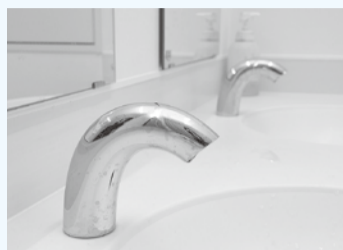
水道の蛇口がセンサー式に。蛇口を触る必要がなく、感染症対策としても安心