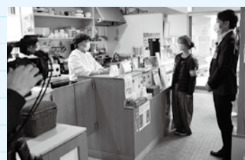
スポット「暮らしの保健室あつきびより」

話を聞くうちに、私にもできることがあると分かってきました。一人一人がSDGsを意識し、一つでも日々の生活に取り入れることで、大きな力に代わる。そして明るい未来が見える。そんな思いが芽生えたり報告になりました。