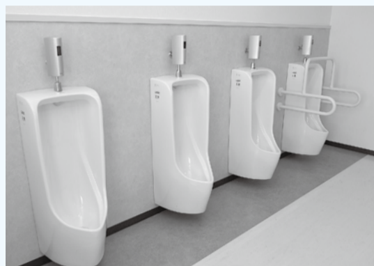
掃き・拭き掃除で衛生的に

三田・厚木第二小学校のトイレの改修工事が、9月末に終わりました。今まで一般的だった湿式から乾式のトイレに変わり、より清掃しやすく、衛生的で明るい施設に生まれ変わりました。