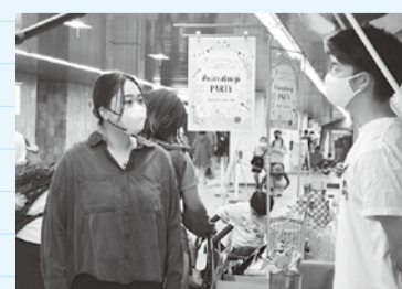
5店が出店しパーティを盛り上げた

ペース、コーヒー・駄菓子などの販売コーナーを設置。大道芸人も地下道でパフォーマンスしていて、訪れた方を笑顔にっていました。インスタグラムで#niceatsugiを付けた投稿写真も展示され、厚木の魅力を再発見できました。出店者の皆さんの「このハッシュタグを通じてお店のことを知ってもらいたい」「厚木の人たちとつながれたら」という言葉から、思いが詰まったパーティだと感じました。このまちの魅力を最大限に発信できるこのハッシュタグを使って、皆さんもぜひSNSに投稿してみてくださいね!