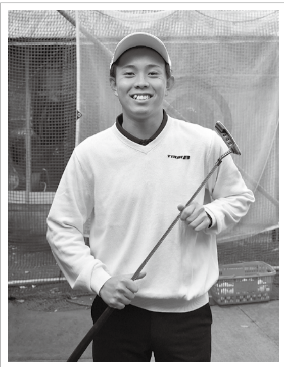
昨年の日本学生ゴルフ王座決定戦で優勝を収めた