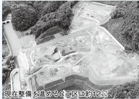
現在整備を進めるC工区は約12%