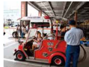
2019年のフェアの様子