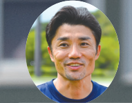
8 陸上・未續選手 特別インタビュー