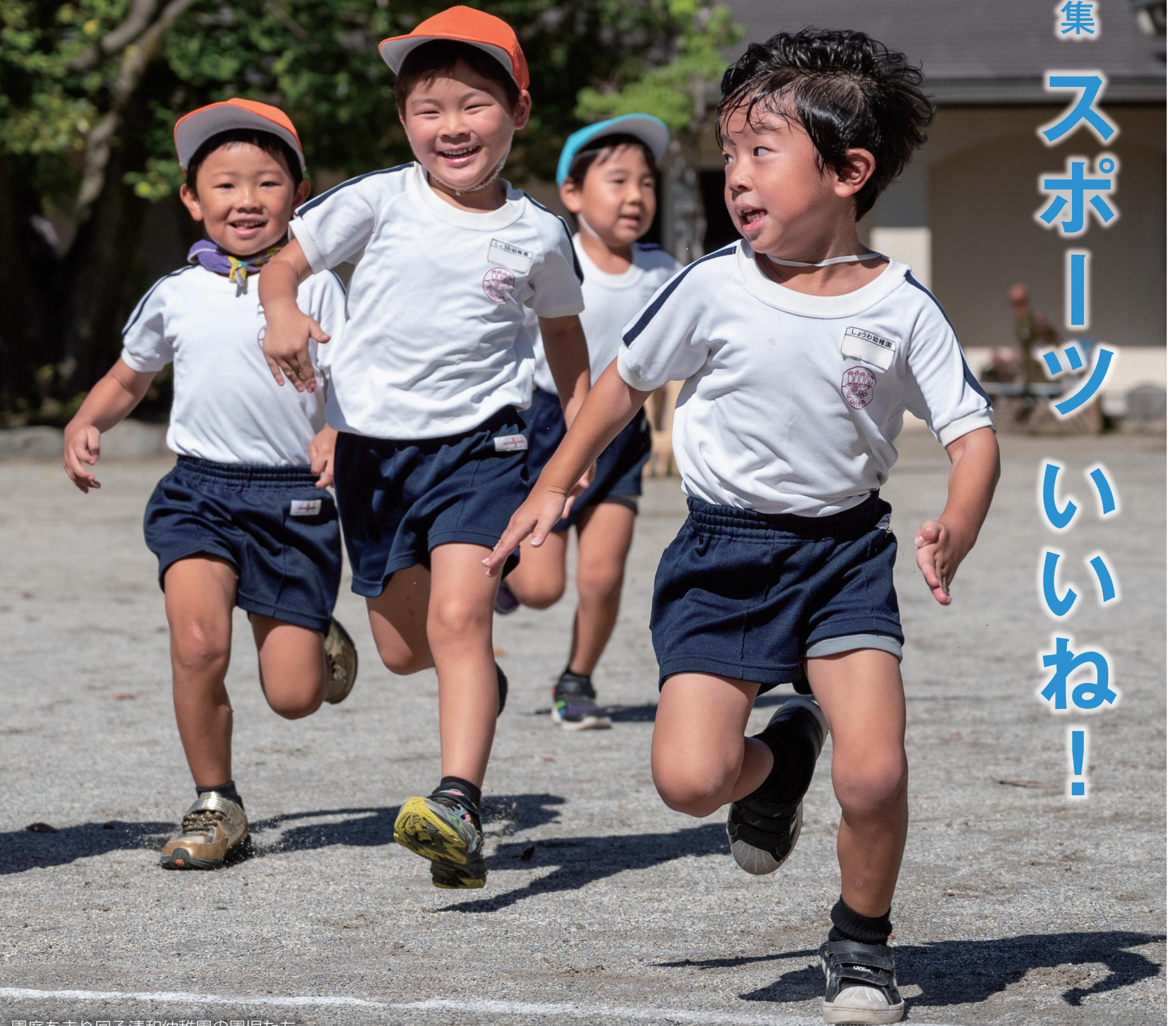
園庭を走り回る清和幼稚園の園児たち