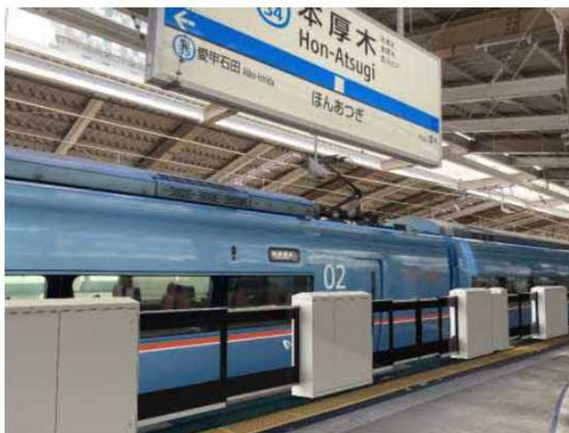
本厚木駅に整備するホームドア（イメージ）