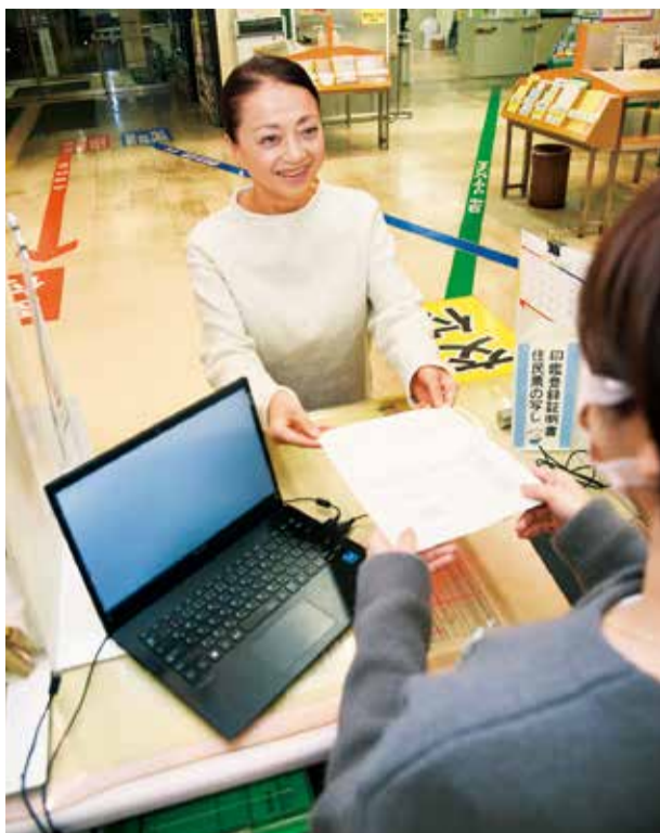
職員が聞き取った内容を申請書に印字し確認