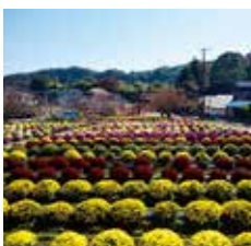
▲あつぎ飯山花の里のさる菊