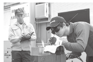
4人のチームで練習に励む

大会では、技術や物の見方など自分にはなかったものが得られ、その経験は業務でも生きています。今年もっと上の成績を残せるよう、技術を磨いていきたいです。