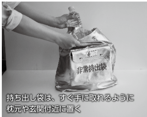
持ち出し袋は、すぐ手に取れるように枕元や玄関付近に置く

災害時は、救援物資が届くまでに時間がかかる場合があります。最低でも3日分、可能であれば7日分を目安に飲料水や食料などを備蓄しましょう。