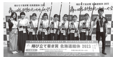
8月に開催された全国大会にも出場した

卒業後も弓道を続けます。大学でも良い成績を残せるよう経験を生かしていきたいです。