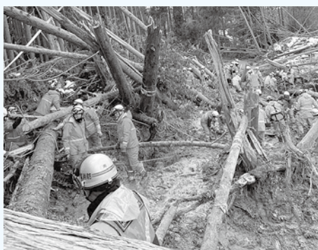
積雪や倒木などで見通しの悪い中、捜索活動をする消防隊員