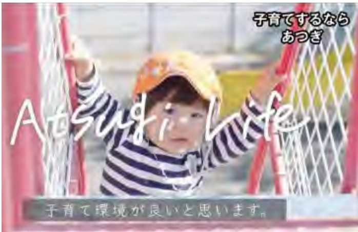
施設や制度を利用する保護者の声や子どもたちを映した