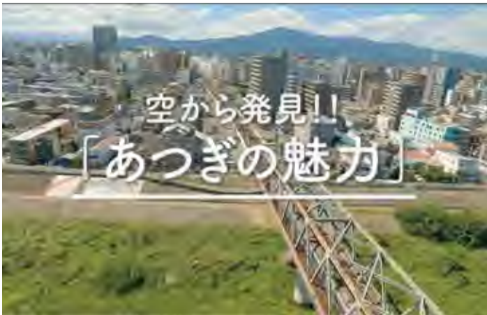
ドローンで空から捉えた躍動感のある映像で魅力を伝える