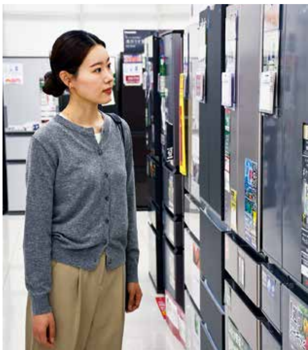
家電に貼ってある省エネラベルを確認

今後も豊かで暮らしやすい環境を次世代につなぐため、できることから始めてみませんか。 環境政策課 ☎25-2749