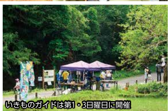
いきものガイドは第1・3日曜日に開催