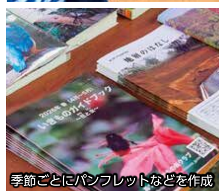
季節ごとにパンフレットなどを作成