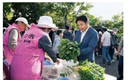
にぎわう会場で新鮮な野菜を購入

初夏の心地よい朝日の下、老若男女の活気あふれる声が響き渡ります。5月9日、森の里地区で開かれた「森もり市」にお邪魔しました。地域の皆さんが企画・運営する森もり市は、5月から12月まで若宮公園で開催される朝市です。地元の家や大学生が集まり、新鮮な地場産野菜や果物、手作りの弁当、ハンドメイド作品などを販売。季節に合わせたイベントも開催しています。会場では出店者との会話を楽しむ