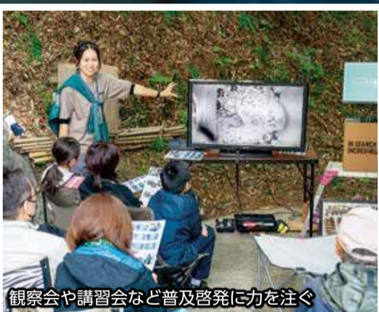
観察会や講習会など普及啓発に力を注ぐ