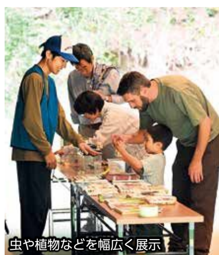
虫や植物などを幅広く展示