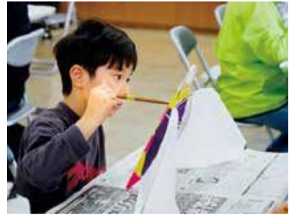
真剣なまなざしで色を塗る子どもたち

七沢に伝わる「せんみ凧」を作って揚げるイベントが4月、玉川公民館などで開かれました。約50人が参加し、ものづくりや地域の交流を楽しみました。