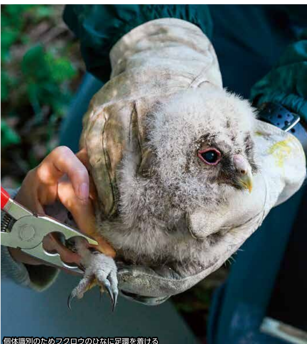
個体識別のためフクロウのひなに足環を着ける

活動に取り組む中で、特に力を入れているのが鳥類の保全や調査です。国の許可が必要な「標識調査」を取り入れ、野鳥に数字や文字が刻まれた環境省の足環を着けて自然へ戻しています。