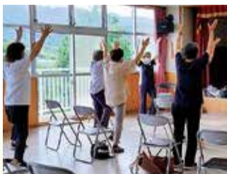
健康体操なども開催

現在は88人が所属。「誰もが孤立することなく、心身共に健康な生活を送ってほしい」という願いの下、皆さんに地域に関わるきっかけの場を提供していきます。