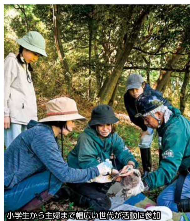
小学生から主婦まで幅広い世代が活動に参加