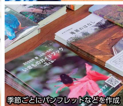
季節ごとにパンフレットなどを作成