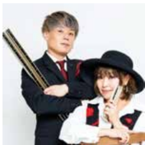
▲ハーモニカデュオBom×Boa