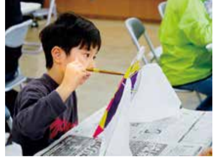
真剣なまなざしで色を塗る子どもたち

七沢に伝わる「せんみ風」を作って揚げるイベントが4月、玉川公民館などで開かれました。約50人が参加し、ものづくりや地域の交流を楽しみました。