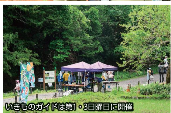
いきものガイドは第1・3日曜日に開催