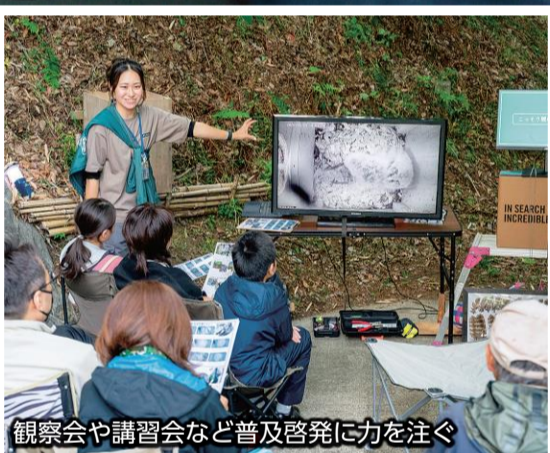
観察会や講習会など普及啓発に力を注ぐ