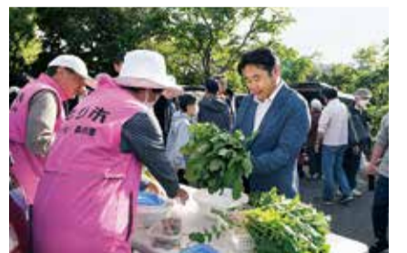
にぎわう会場で新鮮な野菜を購入

皆さんの姿がとても印象に残っています。家族のように会話を交わす皆さんの和やかな雰囲気心が温かくなりました。私もたくさん交流を楽しもううちに、つつい手つぶさがるほどの買い物をしてしまいました。こうした地域に根差した活動は人と人とのつながりを再認識させ、コミュニティの輪を広げてくれます。森の里地区の皆さんが交流の場を創り出し、地域の魅力を発信している姿は、まさに本市が掲げる「共創のまち」の体現といえます。