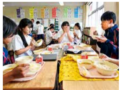
会話を楽しみながらカレーを食べる生徒たち

市立小・中学校の給食で5月、横浜DeNAベイスターズの若手寮で食されている「青星寮カレー」を提供しました。