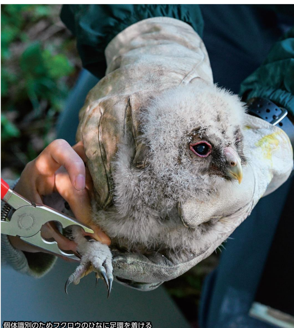
個体識別のためフクロウのひなに足環を着ける

活動に取り組む中で、特に力を入れているのが鳥類の保全や調査です。国の許可が必要な「標識調査」を取り入れ、野鳥に数字や文字が刻まれた環境省の足環を着けて自然へ戻しています。