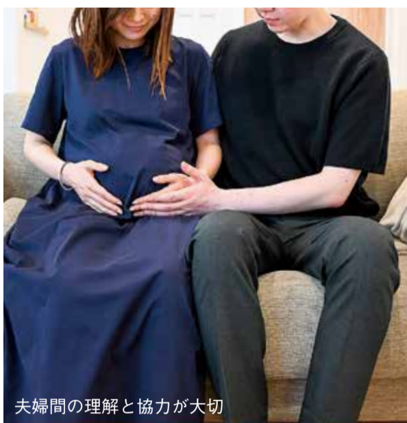
夫婦間の理解と協力が大切

早期不妊検査費の助成は、4月以降に夫婦が受けた精液検査や内分泌検査、超音波検査などが対象。申請は1