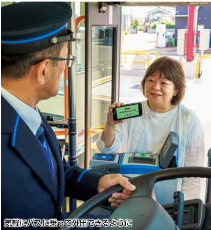
気軽にバスに乗って外出できるように