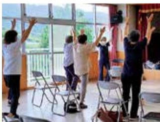
健康体操なども開催

現在は88人が所属。「誰もが孤立することなく、心身共に健康な生活を送ってほしい」という願いの下、皆さんに地域に関わるきっかけの場を提供していきます。