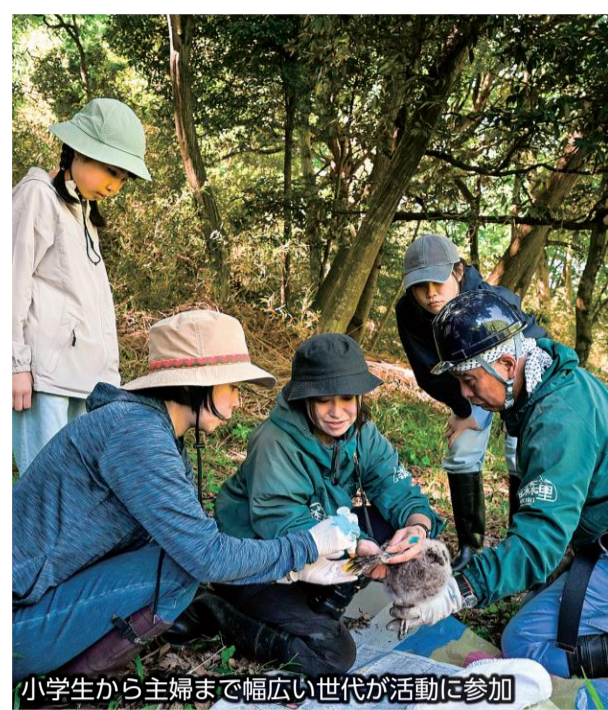
小学生から主婦まで幅広い世代が活動に参加