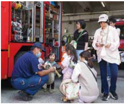
資機材に触れる子どもたち

普段は立ち入れない消防署の内部や車両を見学・体験できる「厚木消防オープンデー」を、5月に開催しました。