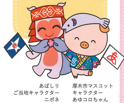
あばしりご当地キャラクター ニボネ 厚木市マスコットキャラクター あゆコロちゃん