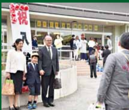
上依知小学校では児童50人が入学

市立小・中学校36校(小学校23校、中学校13校)で4月5日、一斉に入学式が実施されました。桜の花びらが舞う中、新たに1年生になる児童1,839人、生徒1,893人が、期待と希望を胸に新たな第一歩を踏み出しました。各校では、真新しい衣装や制服を身に付けた子どもたちがお父さん、お母さんと記念撮影をする姿が見られました。