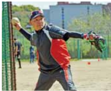
顧問教員を支援する立場から指導に当たる

部活動の活発化を目的に、教育委員会が平成6年から派遣しています。現在74人の協力者が運動部・文化部合わせて80の部活動で生徒を指導。それぞれが持つ豊富な経験を生かして、一人一人の個性や技術を伸ばしています。