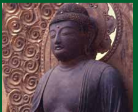
飯山にある金剛寺の木造阿彌陀如来坐像

市内で唯一の国指定重要文化財・木造阿彌陀如来坐像などが4月7日、あつぎ飯山桜まつりの開催に合わせ、一般公開されました。ヒノキ材を使った寄せ木造りの同坐像は、洗練された作風や大きさから、関東における平安時代後期の定朝様式の代表作。県内外から97人が訪れ、普段は公開されていない貴重な文化財を見学しました。