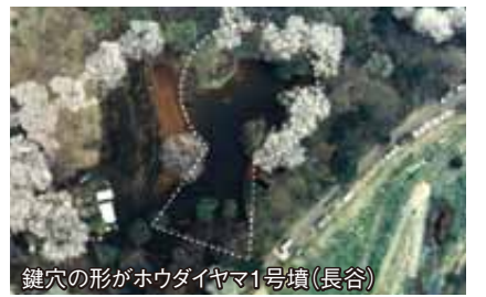
鍵穴の形がホウダイヤマ1号墳(長谷)

古墳は、意外と身近な所にあります。ぼうさいの丘公園の野外ステージのある広場は、実は「ホウダイヤマ1号墳」という