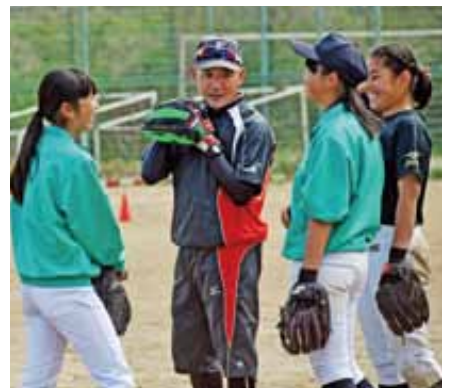
休憩の時は部員たちと和やかに談笑

大会の運営を生徒が手伝うこともありますが、部員のきちんとしたあいさつや気配りはいろいろな方に褒めていただきます。中学生は人としての基礎を築く時期。そうした礼儀やチームワーク、人のために行動する大切さを学ぶことは、これからの長い人生できつと役に立つと思います。 部活動をやり遂げた子どもたちは、入学時とは見違える姿で卒業していきます。その後、成長した教え子たちが学校に顔を出してくれたり、集まりに呼んでくれたりするとき、指導に携わってきた良かったと感じます。いつまでも教え子とつながりを持てるのは本当にうれしいことです。これからも、子どもたちの成長する姿を楽しみに、一緒にボールを追いかけていきたいと思っています。