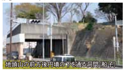
地頭山の前方後円墳の下を通る洞門(船子)

全長65m程の前方後円墳です。また、国道246号のバイパスと旧道が合流する半トンネル型の洞門は、上にある「地頭山古墳」を保存するために造られたもので、全長72mと県内では最大規模です。あなたの家のそばにも古墳があるかも。散歩がてら寄ってみてはいかがでしょうか。