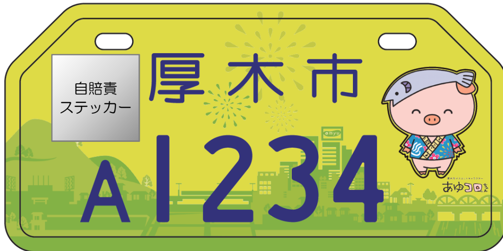
「薄黄色」原動機付自転車(50cc超～90cc以下)