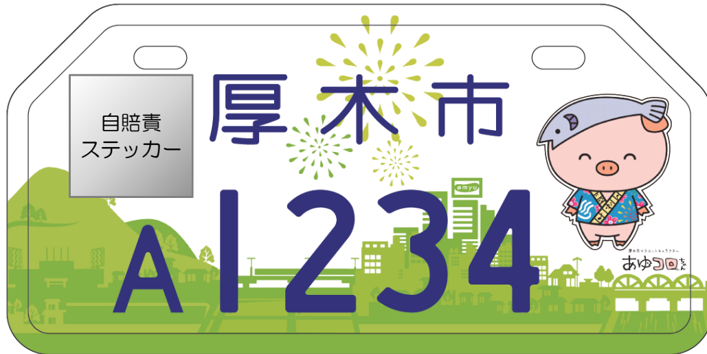
「白」原動機付自転車(50cc以下)