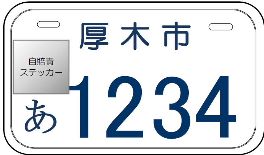
「白」原動機付自転車(50cc以下)