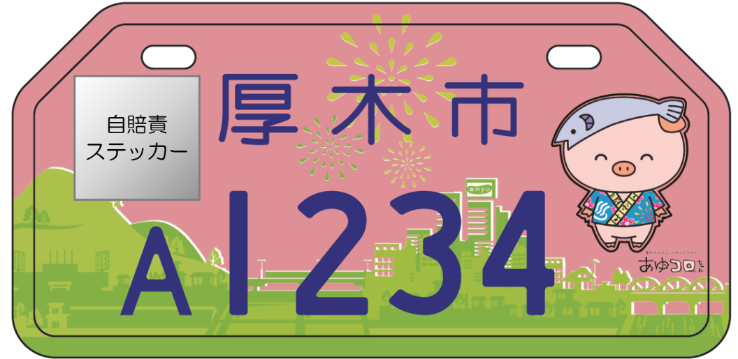
「薄桃色」原動機付自転車(90cc超～125cc以下)