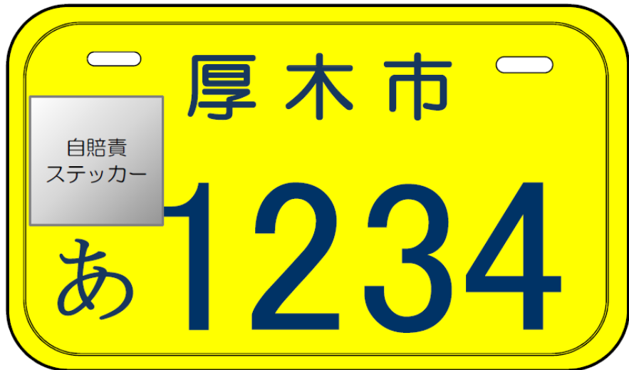
「薄黄色」原動機付自転車(50cc超～90cc以下)