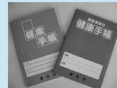
女性用(左)と男性用(右)の2種類

■自分の健康を守るための健康手帳 自分自身の健康管理と、適切な医療を受診するために便利な手帳です。健康診査、歯周疾患検診などの受診結果(5年分)や健康の保持増進のために必要なことを記録できます。いざという時のために、これまで心身に起こったことや服用している薬を「健康手帳」にまとめておきましょう。その他、健康に関する豆知識などを掲載しています。自身の健康づくりにお役立てください。