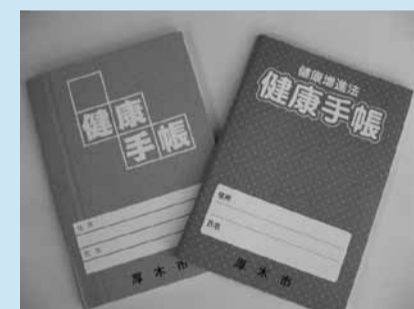
女性用(左)と男性用(右)の2種類

■ 自分の健康を守るための健康手帳 自分自身の健康管理と、適切な医療を受診するために便利な手帳です。健康診査、歯周疾患検診などの受診結果(5年分)や健康の保持増進のために必要なことを記録できます。いざという時のために、これまで心身に起こったことや服用している薬を「健康手帳」にまとめておきましょう。健康に関する豆知識なども掲載していますので、自身の健康づくりにお役立てください。