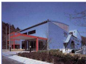
厚木市資源化センター （しげん再生館）

平成10年から、ごみの減量化とリサイクルを目的とした「厚木市資源化センター」の建設に着手し、平成12年から「容器包装に係る分別収集及び再商品化の促進等に関する法律」に適合した、びん、缶及びペットボトルの選別、減容、貯留施設の稼働を開始しました。