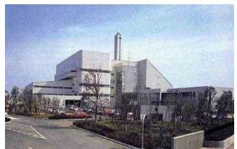
厚木市環境センター

昭和52年から「ごみ減量化と資源の再利用運動」を展開するとともに昭和56年から57年にかけて環境整備事業所を建設し、都市化の進展と増大するごみに対応する本格的処理体制を整えました。