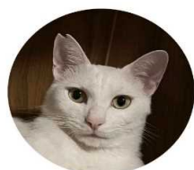
耳カットは 手術済みの印